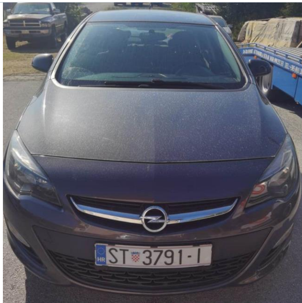
Slike 1. do 5.: Prikaz općeg stanja automobila